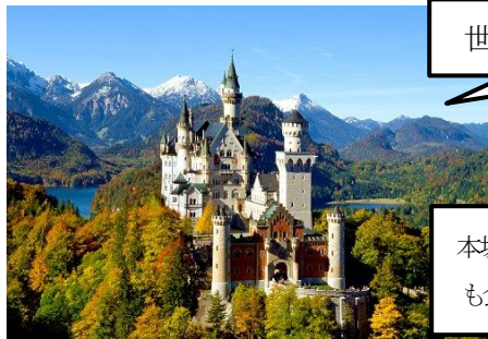
世界遺産・ノイシュヴァンシュタイン城

留学をとおして日本の良さや自分の家で普通に生活することの大切さに気付くこともできました。行く前よりも帰国した時の方が自分自身を見つめなおすことができるようになったと思います。海外留学や旅行へ行って日本とは違う文化に触れてみてください。